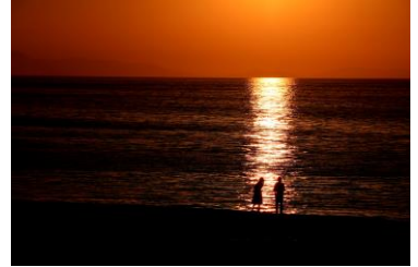
【写真(イメージ)】(撮影:川村高弘先生) 左2枚:バラ 右2枚:マーブルビーチの夕景